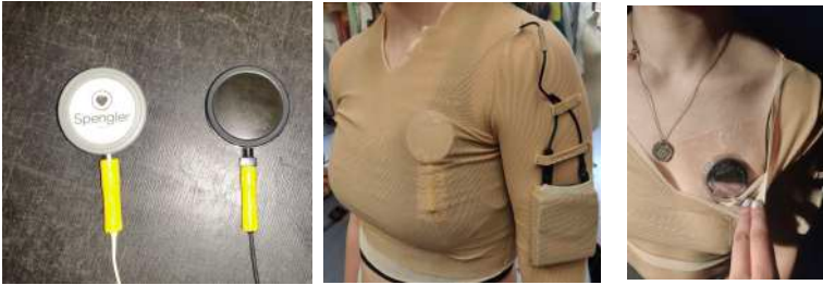
Prototype conçu par Matéo Esnault et essai du dispositif de fixation et émetteur HF.

mémoire autour des sons du corps, a fabriqué, à partir d'un stéthoscope, un micro pour capter en direct les sons du corps humain pour ensuite les distordre comme bon nous semble. Expérimenter: Que se passe-t-il quand un corps s'approche d'un autre corps ? Quand on regarde quelqu'un pendant longtemps ? Capturer les instants où les rythmes intérieurs de nos corps sont métamorphosés par la vue de quelqu'un ou par un baiser.