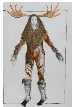
Ébauche de croquis costumes par Clément Desoutter.