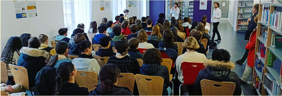
Collège l'Espérance Aulnay-sous-Bois Classes de 6 e , 5 e , 2 ndes CDI