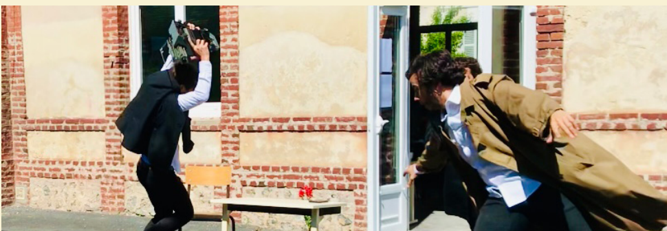
École de Villerville Tout public Cour de récréation