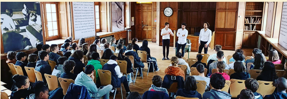
Lycée François I er Le Havre Classes de 2 ndes Bibliothèque