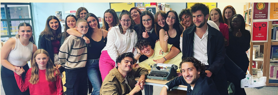
Collège JC Dauphin Nonancourt Classes de 5 e Réfectoire